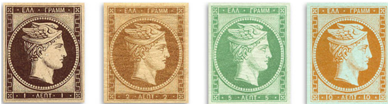
Τα πρώτα ελληνικά γραμματόσημα που τυπώθηκαν στο Παρίσι

Το 1869 τα ελληνικά ταχυδρομεία επιβιβάζονται στο τρένο, ενώ το 1874, πάντα πρωτοπόρα, βρίσκονται παρόντα στην ίδρυση της Παγκόσμιας Ταχυδρομικής Ένωσης στη Βέρνη. Το 1892 το τηλέφωνο προστίθεται στις αρμοδιότητες των ταχυδρομείων και δημιουργείται η Τριατατική (τα 3Τ: ταχυδρομείο, τηλεγραφείο, τηλεφωνείο).