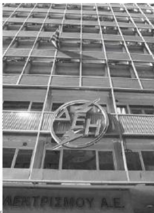
Η εφαρμογή του μέτρου μείωσης των μεριδίων της ΔΕΗ στη λιανική αγορά, μέσω της διάθεσης λιγνιτικής και υδροηλεκτρικής ισχύος, την ίδια στιγμή που η λιγνιτική παραγωγή παρουσιάζει δραματική μείωση, σε συνδυασμό με τις ανεξέλεγκτες οφελές και την απόσχιση του ΑΔΜΗΕ, ο οποίος εισφέρει στη ΔΕΗ περί τα 200 εκατ. λειτουργικά κέρδη ετησίως, συνθέτουν ένα ουσιαστικό πλαίσιο για την επιχείρηση.

Την ίδια στιγμή, οι επτά ιδιωτικές εταιρείες παροχής ηλεκτρικού ρεύματος (Epedison, Hriam, Protergia, NRC, Watt + Volt, VOLTEERRA, GREEN) έποντας διασποράς ήδη ένα μερίδιο της τάξης του 8,62% (Απριλίου) προσεοάζονται για την πρώτη διαπρασσία των 4,114 GWh, που με βάση το Μνημόνιο θα πρέπει να γίνει μέχρι τον Σεπτέμβριο του 2016, μέσα από έναν πόλεμο προσφορών και εκπτώσεων, αξιοποιώντας και τα νέα περιθώρια που διασφαλίζει η μείωση του ΕΦΚ στο φυσικό αέριο και η κατάργησή του στον λιγνίτη που χρησιμοποιείται στην ηλεκτροπαραγωγή. Η μεγάλη τερη μετακίνηση πελατών καταγράφεται στη μέση τάση από την οποία τροφοδοτούνται βιομηχανίες και μεγάλοι εμπορικοί καταναλωτές με τους ιδιώτες παρόχους να συγκεντρώνουν μερίδιο άνω του 18%. Σύμφωνα με τα στοιχεία του Παρα-