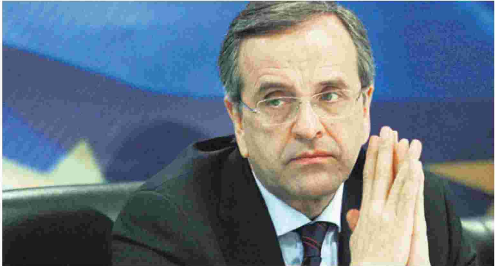
Επιτελείς του πρωθυπουργικού γραφείου αναζητούν ευθύνες για τους αργούς ρυθμούς που παρατηρούνται στη διαδικασία των ιδιωτικοποιήσεων

ΝΕΥΡΙΚΟΤΗΤΑ αλλά και ενόχληση για την ολιγωρία που παρατηρείται στις αποκρατικοποιήσεις της χώρας υφέρπουν αυτή την περίοδο στο Μέγαρο Μαξίμου. Επιτελείς του πρωθυπουργικού γραφείου αναζητούν ευθύνες για τους αργούς ρυθμούς που παρατηρούνται στη διαδικασία των ιδιωτικοποιήσεων, τόσο από την πλευρά του Ταμείου Αξιοποίησης Ιδιωτικής Περιουσίας του Δημοσίου όσο και από ορισμένους υπουργούς της κυβέρνησης.