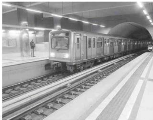
Μεταξύ των ΔΕΚΟ που θα περάσουν στο υπερταμείο είναι και η εταιρεία Αττικό Μετρό.

ιδιωτικοποιήσεων του ΤΑΙΠΕΔ, αυτό επίσης παραμένει υπό συζήτηση, με τους Ευρωπαίους να θέλουν να παραμείνουν εντός τα δέκα περιφερειακά λιμάνια και την κυβέρνηση να επιδιώκει τη μεταφορά τους στην Εταιρεία Δημοσίων Συμμετοχών (ΕΔΗΣ). Είναι η μία εκ των τεσσάρων θυγατρικών του υπερταμείου (οι άλλες είναι το ΤΧΣ, το ΤΑΙΠΕΔ και η ΕΤΑΔ), στην οποία περνούν ΕΥ-