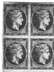
Λαμπρό δείγμα τετράδας 80λεπτου από την αθηναϊκή έκδοση του 1861-62

Σταδιακά η εμπειρία των υπαλλήλων του τυπογραφείου βελτιώθηκε, η ποιότητα του χαρτιού εκτύπωσης άλλαξε προς το καλύτερο, και κατ' αυτό τον τρόπο διακρίνουμε δυο υποκατηγορίες αυτής της περιόδου: Τις χοντροκομμένες εκδόσεις και τις εκλεπτυσμένες εκδόσεις. Όλες οι αθηναϊκές εκδόσεις φέρουν αριθμούς ελέγχου στην πίσω πλευρά εκτός από τα μονόλεπτα και εκείνα των δυο λεπτών. Αυτοί οι αριθμοί ελέγχου είναι πολύ χαρακτηριστικοί - 6.5 χιλιοστά σε ύψος - λεπτοί στην αριστερή πλευρά και με ισχυρή σκίαση στη δεξιά. Όπως και με την παρισινή έκδοση το χαρτί εκτύπωσης παρουσιάζει ελαφριά σκίαση στην ίδια απόχρωση με εκείνη του γραμματοσήμου με εξαίρεση τα 10-λεπτα και τα 40-λεπτα.