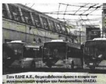
Στην ΕΔΗΣ Α.Ε., θα μεταβιβαστούν άμεσα η εταιρία των συγκοινωνιακών φορέων του Λεκανοπεδίου (ΟΑΣΑ).