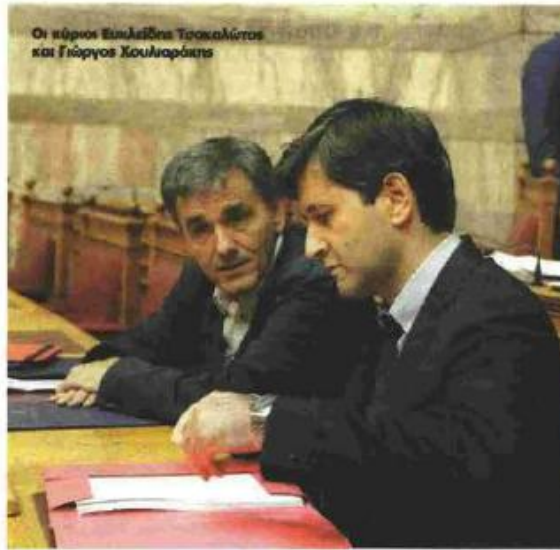
Οι κύριοι Ευκλείδης Τσακαλώτος και Γιώργος Κουλιάρης

Αντίθετα, ο αναπληρωτής υπουργός Οικονομικών Γιώργος Κουλιάρης κατέθεσε άλλο παράρτημα, σύμφωνα με το οποίο μεταβιβάζονται στην Εταιρεία Δημοσίων