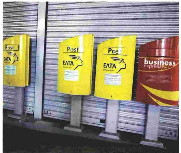
Τα νέα οκτώ δέματα τοποθετήθηκαν σε κιβώτια των ΕΛΤΑ, στις 14 Μαρτίου 2017 και εντοπίστηκαν στο κέντρο διαλογής στο Κρουσνέρι, επιβεβαιώνοντας το ρεπορτάζ του «Ε.Τ.».

Τα πακέτα εστάλησαν στη Διεύθυνση Εγκληματολογικών Ερευνών της ΕΛΑΣ για να εξεταστούν για τυχόν ίννη DNA ή αποτυπώματα, καθώς το γεγονός ότι δεν εξεργάσαν ενοχές τις έρευνες. Αυτό που θέλει κυρίως η ΕΛΑΣ είναι να βρει την ταυτότητα του κατασκευαστή των βομβών, που δεν αποκλείεται να είναι ο ίδιος με αυτόν που