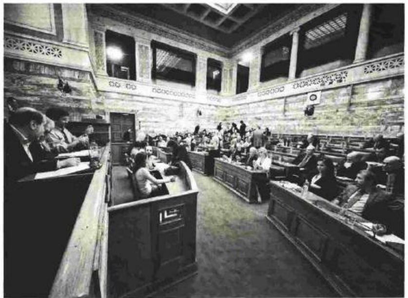
Την επόμενη εβδομάδα θα καταθεί το Πλάνο Αξιοποίησης της Περιουσίας, που περιλαμβάνει τις 19 αποκρατικοποιήσεις. Θα πρέπει να πάρει πρώτα το «πράσινο φως» από το ΚΥΣΟΠ

ξία των συμμετοχών αυτών και να τις αξιοποιεί σύμφωνα με βέλτιστες διεθνείς πρακτικές και τις κατευθυντήριες γραμμές του ΟΟΣΑ, όσον αφορά την εταιρική διακυβέρνηση, την εταιρική συμμόρφωση, την εποπτεία και τη διαφάνεια των διαδικασιών, καθώς και σύμφωνα με τις βέλτιστες πρακτικές σε θέματα κοινωνικά και περιβαλλοντικά υπεύθυνης επιχειρηματικότητας και διαβούλευσης με τα ενδιαφερόμενα με τις δημόσιες επιχειρήσεις μέρη. Οι δημόσιες επιχειρήσεις που ελέγχονται από την ΕΔΗΣ, υπόκεινται σε κατάλληλη εποπτεία σύμφωνα με τους κανόνες της εθνικής και ευρωπαϊκής νομοθεσίας, υλοποιούν και