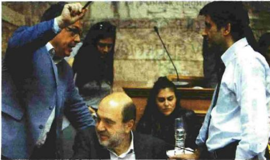
ΟΙ ΑΝΑΠΛΗΡΩΤΕΣ ΥΠΟΥΡΓΟΙ Οικονομικών Τρ. Αλεξιάδης και Γ. Χουλιαράκης με τον κοινοβουλευτικό εκπρόσωπο του ΣΥΡΙΖΑ Σ. Φάμελλο κατά τη χθεσινή συνεδρίαση των επιτροπών της Βουλής