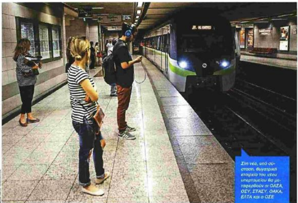
Στη νέα, υπό σύσταση, θυγατρική εταιρεία του νέου υπερταμείου θα μεταφερθούν οι ΟΑΣΑ, ΟΣΥ, ΣΤΑΣΥ, ΟΑΚΑ, ΕΛΤΑ και ο ΟΣΕ

Ανάμεσα σε αυτά ξεχωρίζουν: Αγορά Μοδιάνο στη Θεσσαλονίκη, Φυλακές Κασσάνδρας Χαλκιδικής, Πάρτο Χέλι, Ιππικό Ολυμπιακό Κέντρο Μαρκόπουλου, Ολυμπιακό Κωπηλοδρομίο Σκιά, Γούρνες Ηρακλείου, 7 κοιμητικές πηγές, δεκάδες ακίνητα, κτίρια, αγροτεμάχια και ξενοδοχεία σε όλη την Ελλάδα, πρώην εμπορική, ακίνητα εξωτερικού σε Νότια Αφρική, Ιταλία, Αρμενία, καθώς επίσης και οι ιδιωτικοποιήσεις - αέρια: Κασσιόπη Κέρκυρας, Αφάντου Ρόδου, Αστέρας Βουλιαγμένης, Ελληνικό.