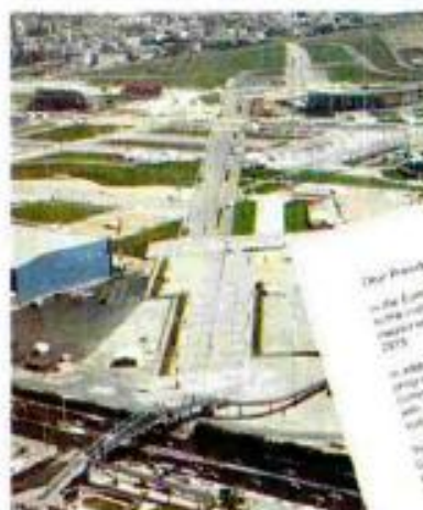
Με το νέο Υπερταμείο έπαινος στη μορφή στα τη δομή κοινής εταιρείας θα μπορέσει να υποδεσφεί τα υφιστάμενα δομές των ΤΧΣ, ΤΑΙΠΕΔ και ΕΤΑΑ (αριστερά)