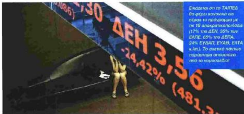
Εικόνα: οπ το ΤΑΙΠΕΔ θα φέρει κανονικά εις πέρας το πρόγραμμα με τις 19 αποκρατικοποιήσεις (17% της ΔΕΗ, 35% των ΕΛΠΕ, 65% της ΔΕΠΑ, 24% ΕΥΔΑΠ, ΕΥΑΘ, ΕΛΤΑ κ.λπ.). Το σχετικό πάντως παράρτημα απουσιάζει από το νομοσχέδιο!

από τη Γενική Συνέλευση του βασικού μετόχου, το Εποπτικό Συμβούλιο και το Διοικητικό Συμβούλιο. Κεντρικό ρόλο στη λειτουργία του νέου υπερταμείου θα διαδραματίζει το Εποπτικό Συμβούλιο (Supervisory Board) που θα απαρτίζεται από 5 μέλη, τα οποία θα επιλέγονται τόσο από την ελληνική πλευρά όσο και από τους δανειστές. Συγκεκριμένα, η ελληνική πλευρά θα διορίζει τα 3 μέλη και η Κομισιόν μαζί με τον Ευρωπαϊκό Μηχανισμό Σταθερότητας τα άλλα 2, ανάμεσα στα οποία και ο πρόεδρος του Εποπτικού Συμβουλίου. Οι αποφάσεις θα λαμβάνονται κατόπιν πλειοψηφίας τεσσάρων μελών.