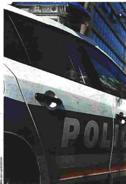
ΕΡ. ΛΙΑΣ ΝΕΣΦΥΤΕ

Ο παγιδευμένος φάκελος ταξίδεψε αεροπορικά από την Αθήνα στο Βερολίνο – βάζοντας σε κίνδυνο ακόμα και τη ζωή των επιβατών –, φθάνοντας μια ανάσα από τον Βόλφγκανγκ Σόιμπλε.