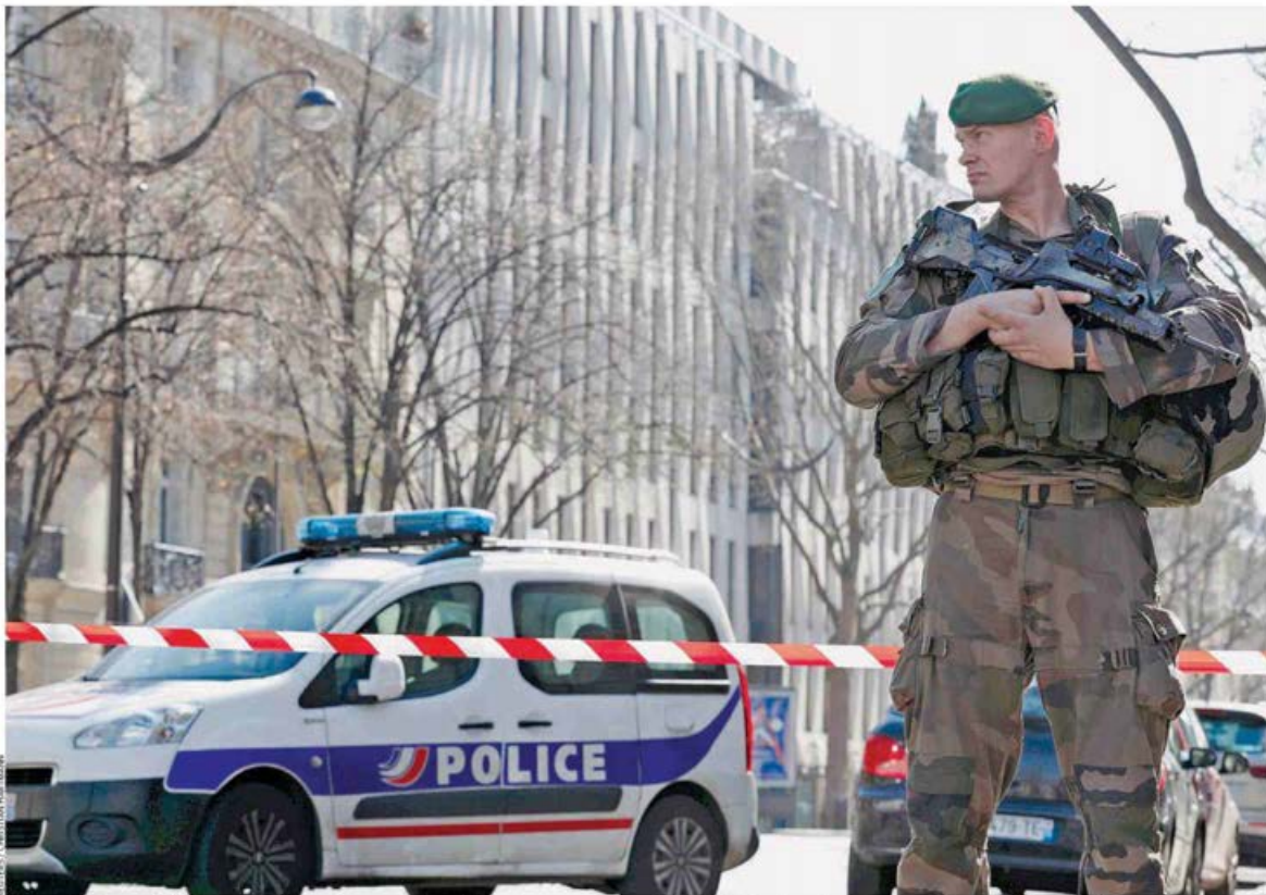
Περιπολικό της γαλλικής αστυνομίας και ένας στρατιώτης έξω από τα γραφεία του ΔΝΤ στο Παρίσι, όπου έσκασε χθες το μεσημέρι δέμα-βόμβα, τραυματίζοντας τη βοηθό του επικεφαλής του ευρωπαϊκού γραφείου του Οργανισμού. Πανομοιότυπο δέμα-βόμβα είχε σταλεί προχθές στον κ. Σόιμπλε στο Βερολίνο.

αποστολή της βόμβας στον Γερμανό υπουργό Οικονομικών Βόλφγκανγκ Σόιμπλε. Η ίδια οργάνωση, το 2010, είχε στείλει 14 δέματα-βόμβες σε Ευρωπαίους πολιτικούς και πρεσβείες στην Ελλάδα και στο εξωτερικό. Στο χαμπλό εύρος ευαισθησίας των μηχανημάτων, από όπου περνούν όλα τα ταχυδρομικά αντικείμενα, εντοπίζεται, σύμφωνα με τις εκτιμήσεις, το κενό ασφαλείας. Σελ. 3