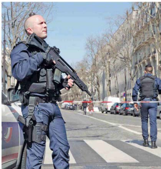
Το δέμα με τον αυτοσχέδιο εκρηκτικό μηχανισμό έφτασε χθες, λίγο μετά τις δώδεκα το μεσημέρι, στα γραφεία του ΔΝΤ το Παρίσι.

«Ανεβάσαμε το επίπεδο ετοιμότητάς μας», δήλωσε στην «Κ» εκπρόσωπος της Ευρωπαϊκής Κεντρικής Τράπεζας.