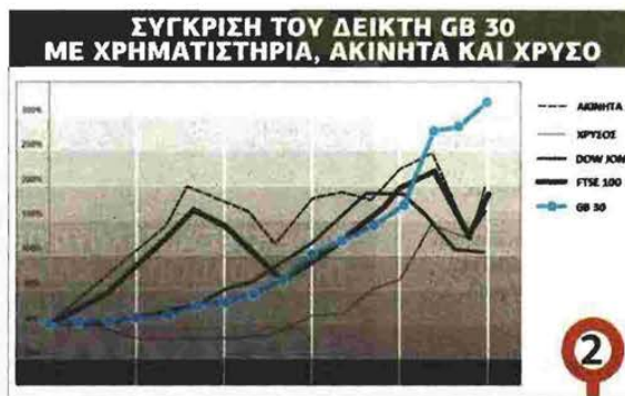
Ο Δείκτης GB30 Rarities Index έχει δείξει ένα ετήσιο ποσοστό αύξησης της τάξης του 10% για τα τελευταία 40 χρόνια, όταν οι περισσότερες άλλες κατηγορίες περιουσιακών στοιχείων ήταν σε ύφεση

Voice Ενδεχομένως θα εκπλαγείτε όταν μάθετε ότι τα γραμματόσημα αποτελούν την αγαπημένη μορφή επενδύσεων του δισεκατομμυριούχου των ομολόγων, Μπιλ Γκρος της Pimco. Κατά τη διάρκεια της ζωής του, ο Γκρος έχει επενδύσει, σύμφωνα με πληροφορίες, μεταξύ 50 και 100 εκατ. δολάρια για την αγορά γραμματοσήμων. Αυτό δεν είναι ένα ασήμαντο κομμάτι των 2,2 δισ. δολαρίων της περιουσίας του. Τα γραμματόσημα ήταν, μάλιστα, μεταξύ των πιο κερδοφόρων επενδύσεων του Γκρος.