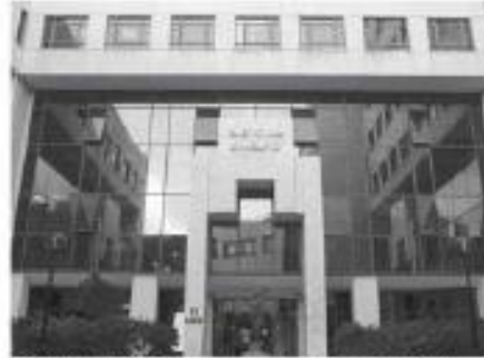
Το Ελεγκτικό Συνέδριο έκρινε ότι η προσφορά των ΕΛΤΑ ήταν χαμηλότερη του κόστους.