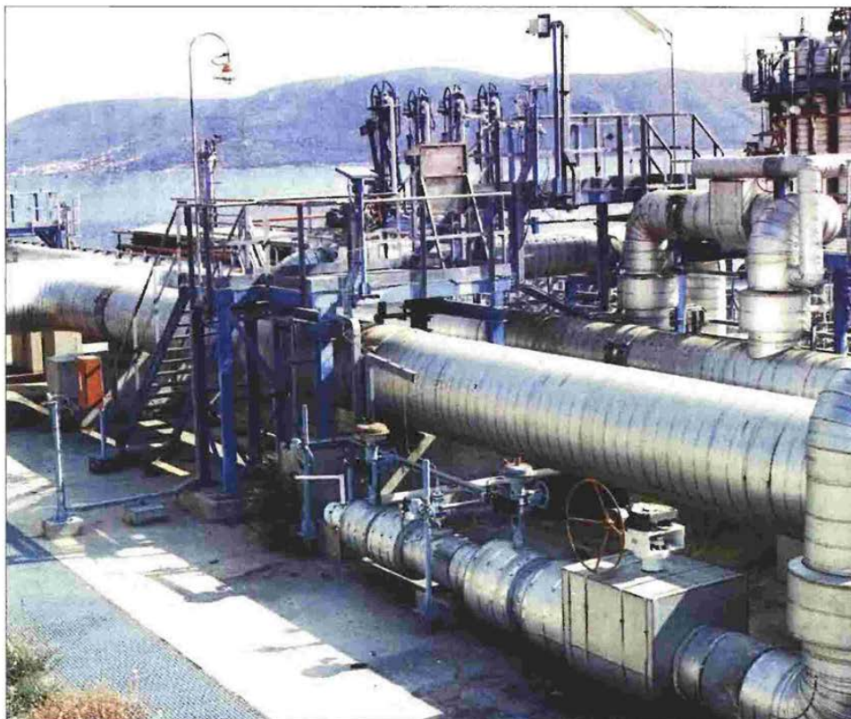
Ο τεματιώδης σταθμός αποθήκευσης υγροποιημένου αερίου του ΔΕΣΦΑ στη Ρεθυθούσα

Αμφίβολη παραμένει η τύχη των προβληματικών περιουσιακών στοιχείων, όπως τα Ελληνικά Ταχυδρομεία (ΕΛ.Τ.Δ.), τα οποία μπορεί να περιέλθουν εδώ και χρόνια στο ΤΑΙΠΕΔ, όμως το 85% του κόστους εξακολουθεί να αφορά τη μισθοδοσία! Αντίστοιχα είναι η εικόνα και στα μεγάλα περιφερειακά λιμάνια, που έχουν περιέλθει εδώ και χρόνια στο ΤΑΙΠΕΔ, αλλά ακόμα και σήμερα δεν υπάρχει σχέδιο αξιοποίησης. Κι αν είχαν προσληφθεί μισή ντουζίνα σύμβουλοι! Μάλιστα προ ημερών επιχειρήθηκε η μεταβίβαση και των 10 λιμανιών στο Υπερταμείο, αλλά την τελευταία στιγμή επικράτησε η άποψη να εξεταστούν πρώτα τυχόν πιθανότητες αξιοποίησης ορισμένων εξ αυτών.