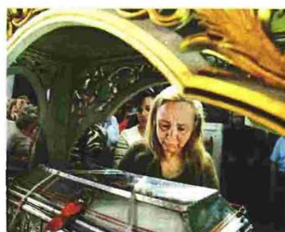
Σύμφωνα με δημοσιεύματα, την Αγία Βαρβάρα μέσα σε 15 μέρες προσκύνησαν 600.000 πιστοί που άφησαν στο παγκάρι περίπου 400.000 ευρώ, με τον μέσο ημερήσιο όρο να φτάνει τα 18.000 ευρώ, τα οποία κατά τους ιερείς διατέθηκαν σε φιλανθρωπικούς σκοπούς