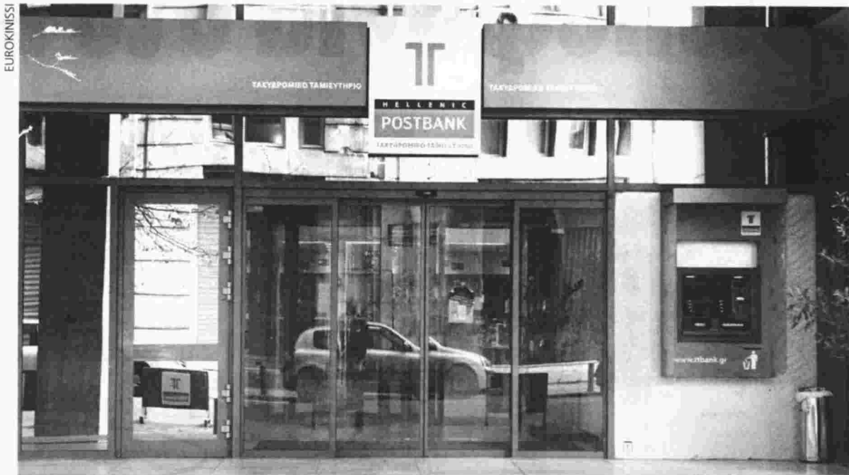
Οι εργαζόμενοι στο Τ.Τ. πιέζουν να ξεκινήσει άμεσα ο διάλογος για το πρόγραμμα της εθελουσίας εξόδου

Υπό αυτές τις συνθήκες ζητά να ορισθούν άμεσα εκπρόσωποι του και να αρχίσει ο διάλογος με στόχο την ολο-