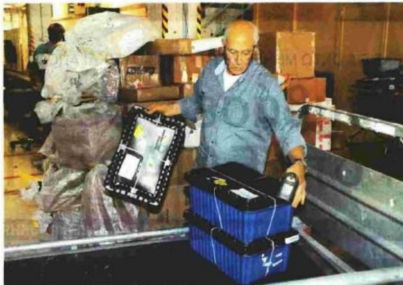
Στα καταστήματα των ΕΛΤΑ στους Νομούς Αχαΐας, Ηλείας, Κεφαλληνίας, Κορινθίας και Λακωνίας θα απασχοληθούν συνολικά 23 διανομείς, διαμετακομιστές και υπάλληλοι εσωτερικής εκμετάλλευσης

Τέλος, το Κέντρο Διαλογής Θεσσαλονίκης θα ενισχυθεί με 5