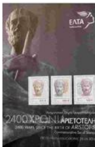
Αναμνηστικά σειρά για αυτοκλήσιμα για τα 2.400 χρόνια από τη γεννηση του Αριστοτέλη.

«Όλοι διεψούν για γνώση, αλλά οι περισσότεροι δεν θέλουν να μάθουν. Ο Αριστοτέλης είχε την παθολογική-αρρωστημένη σχεδόν- ανάγκη να κατανοήσει τον κόσμο».