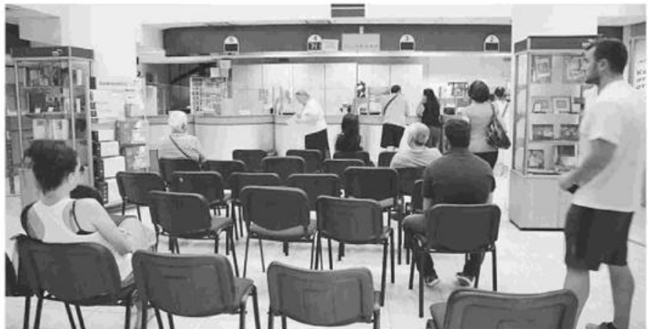
Έλλειψη προσωπικού και απουσία προσλήψεων οδήγησαν σε συρρίκνωση του ωραρίου λειτουργίας των ΕΛ.ΤΑ. στο Βόλο