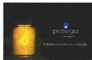
protergia Η φιλική λύση της ενέργειας