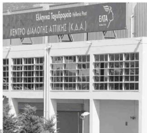
Το ταμειακό έλλειμμα των ΕΛΤΑ ξεπερνάει τα 4 εκατ. ευρώ σε μηνιαία βάση, ενώ η προεξόφληση απαιτήσεων μεγάλων πελατών εξαντλείται.

Οι λειτουργικές ζημιές (ebitda) εκτοξεύθηκαν σε 28,1 εκατ. ευρώ, είναι δηλαδή υψηλότερες κατά προσέγγιση έξι φορές συγκριτικά με αυτές που είχαν προϋπολογιστεί (-5,8 εκατ.). Ακόμη το (αρνητικό) περιθώριο λειτουργικής κερδοφορίας εκτοξεύθηκε, για πρώτη φορά τουλάχιστον από το 2014, σε -12,3%.