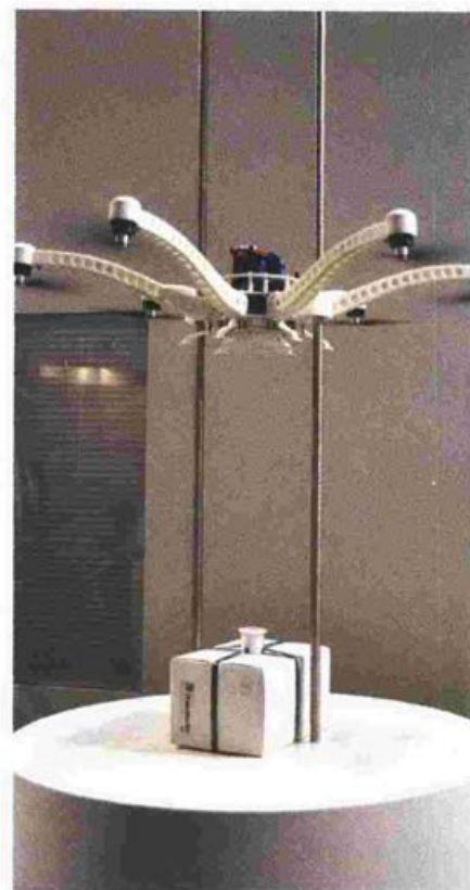
Επίδειξη παραλαβής δέματος από drone στο περίπτερο της Fraunhofer Austria Research στην έκθεση «Transport Logistics» του Μονάχου.

Η εταιρεία Drone Delivery Canada (DDC) ανακοίνωσε ότι προχώρησε σε συμφωνία με τη NAPA Canada μια από τις μεγαλύτερες εταιρείες του Καναδά στον τομέα των ανταλλακτικών αυτοκινήτων προκειμένου να θέσουν σε δοκιμαστική εφαρμογή τη παράδοση ανταλλακτικών σε πελάτη της UAP με τη χρήση drones. Για το σκοπό αυτό η DDC έχει σχεδιάσει και αναπτύξει ένα πρωτότυπο drone το οποίο θα μπορεί να ανταποκρίνεται στις συγκεκριμένες συσκευασίες των ανταλλακτικών, στις διαστάσεις και στα βάρη τους. Αρχικά, οι μεταφορές θα αφορούν πτήσεις drone από κεντρικές αποθήκες σε υποκαταστήματα ανταλλακτικών και σε δεύτερη φάση θα ξεκινήσουν πτήσεις από τα υποκαταστήματα προς τους πελάτες της περιοχής.