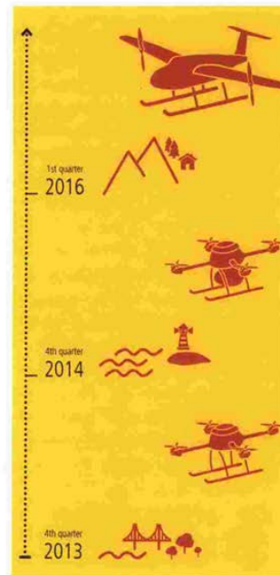
Οι τρεις χρονίες-σταθμοί στην εξέλιξη του DHL Parcelcopter .

«Logistics on the last mile» –Logistics στο τελευταίο μίλι– είναι ο τίτλος αναπτυξιακού σχεδίου του ινστιτούτου Fraunhofer που πιστεύει ότι το τελικό στάδιο της παράδοσης προϊόντων στην πόλη μπορούν να το αναλάβουν ρομπότ κινούμενα επί εδάφους σε αντίθεση με τα ιπτάμενα drones. Σε σχετική μελέτη αναφέρεται ότι πλέον τα «νοικοκυριά» στις πόλεις αποτελούνται από λίγα μέλη, δύο-τρία άτομα