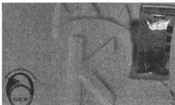
Εμφανίστηκε σε κατάστημα διανομής δεμάτων των ΕΛΤΑ, 34χρονος Έλληνας ο οποίος ζήτησε να παραλάβει το συγκεκριμένο ταχυδρομικό δέμα. Για την παραλαβή χρησιμοποίησε πλαστό δελτίο αστυνομικής. Το δέμα περιείχε ποσότητα κοκαΐνης άνω των τριών 3 κιλών.

ΤΗ σύλληψη 34χρονου ημεδαπού για εισαγωγή στην ελληνική επικράτεια 3 κιλών και 68 γραμμαρίων κοκαΐνης ανακοίνωσε το ΣΔΟΕ. Ειδικότερα, όπως ανακοινώθηκε το τμήμα Δίωξης Ναρκωτικών - Όπλων & λοιπών ελεγχόμενων προϊόντων της Επιχειρησιακής Διεύθυνσης Αττικής της Ειδικής Γραμματείας του Σ.Δ.Ο.Ε., οι Βελγικές Τελωνειακές Αρχές και το Συντονιστικό Όργανο Δίωξης Ναρκωτικών-Εθνική Μονάδα Πληροφοριών (Σ.Ο.Δ.Ν-Ε.Μ.Π) οργάνωσαν συντονισμένη επιχείρηση ελεγχόμενης μεταφοράς ταχυδρομικού δέματος. Το δέμα προερχόταν από Βρυξέλλες και είχε τελικό προορισμό τη χώρα μας. Η επιχείρηση είχε τη σχετική έγκριση της κ. Εισαγγελέως Εφετών Αθηνών. Συγκεκριμένα την 15-10-2018 εμφανίστηκε σε κατάστημα διανομής δεμάτων των ΕΛΤΑ, 34χρονος ημεδαπός ο οποίος ζήτησε να παραλάβει το συγκεκριμένο ταχυδρομικό δέμα. Για την παραλαβή χρησιμοποίησε πλαστό δελτίο αστυνομικής ταυτότητας με στοιχεία κατόχου τα αναγραφόμενα επί του δέματος, ως στοιχεία παραλήπτη. Το δέμα περιείχε ποσότητα κοκαΐνης άνω των τριών (3) κιλών.