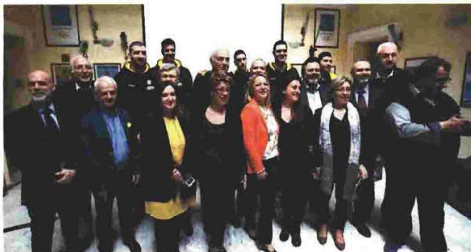
Οι παίκτες της ΑΕΚ παραβρέθηκαν στην παρουσίαση της αναμνηστικής σειράς γραμματοσήμων των Ελληνικών Ταχυδρομείων με τον τίτλο «ΑΕΚ - 50 χρόνια από την κατάκτηση του Κυπέλλου Κυπελλούχων Ευρώπης στην Καλαθοσφαίριση».

Ο ΣΑΚΟΤΑ ΣΚΕΦΤΕΤΑΙ ΝΑ ΠΡΟΦΥΛΑΞΕΙ ΤΟΝ ΧΑΡΙΣ ΣΤΟ ΜΑΤΣ ΜΕ ΤΟΝ ΟΛΥΜΠΙΑΚΟ