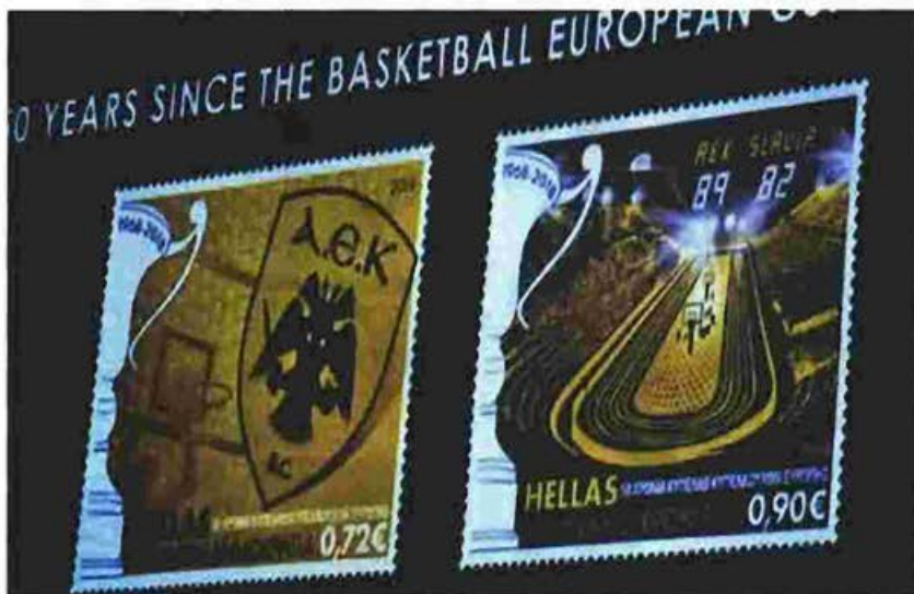
Τα αναμνηστικά γραμματόσημα για το έπος της ΑΕΚ το 1968

ΤΑ ΕΛΤΑ ΚΑΙ Η ΑΕΚ ΠΑΡΟΥΣΙΑΣΑΝ ΧΘΕΣ ΣΤΟ ΚΑΛΛΙΜΑΡΜΑΡΟ ΤΗΝ ΣΕΙΡΑ ΓΡΑΜΜΑΤΟΣΗΜΩΝ ΠΟΥ ΗΤΑΝ ΑΦΙΕΡΩΜΕΝΗ ΣΤΗΝ ΧΡΥΣΗ ΣΤΙΓΜΗ ΤΗΣ ΕΝΩΣΗΣ ΤΟ 1968