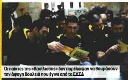
Οι παίκτες της «Βασιλίσσας» δεν παρέλειψαν να θαυμάσουν την άφουγκ δουλειά που έγινε από τα ΕΛΤΑ