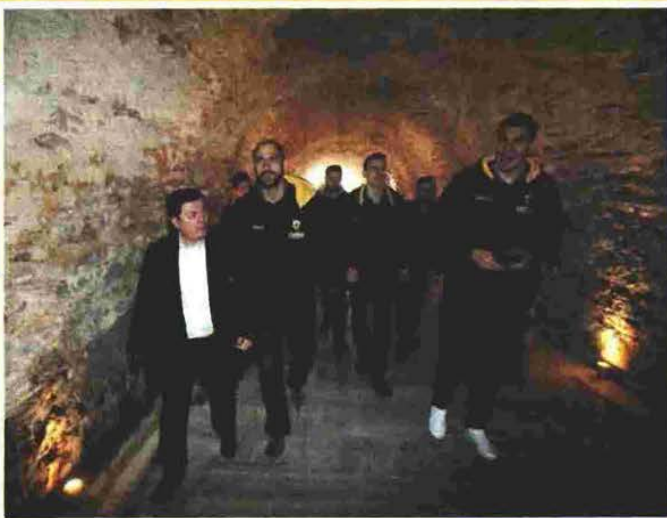
Οι ποίκτες της «Ένωσης» βίωσαν τη μοναδική εμπειρία, να περπατήσουν την ίδια διαδρομή με τους Κυπελλούχους Ευρώπης