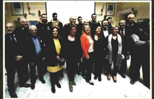
Το παρελθόν και το παρόν της ΑΕΚ, σε αναμνηστική φωτογραφία με τα στελέχη των ΕΛΤΑ