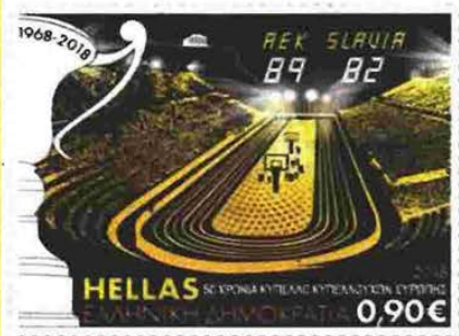
Το έπος του '68, πλέον και σε γραμματόσημο

Στους πρόποδες του πευκόφυτου παράδεισου της Αθήνας, «κείται» το