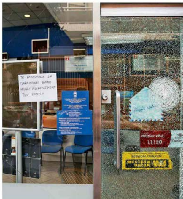
Κουκουλοφόροι προκάλεσαν ζημιές με βαριοπούλες στην είσοδο υποκαταστήματος των ΕΛΤΑ στον Ταύρο.