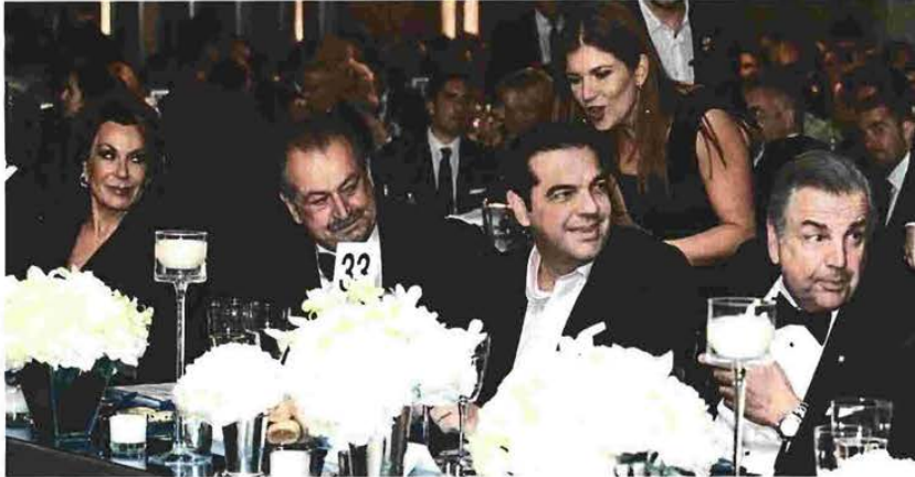
Πριν την συνάντηση στο Νταβός ο Αντρίου Λιβέρης είχε δειννήσει με τον Αλέξη Τσίπρα σε εκδήλωση που οργανώθηκε τον Οκτώβριο του 2015 στον 54ο όροφο, του «World Trade Center 4» της Νέας Υόρκης. Δίπλα του η Γιάννα Αγγελουπούλου