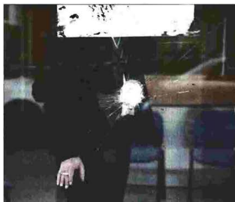
Εικόνες από τις ζημιές στα γραφεία των ΕΛ.ΤΑ. (Ταύρος), του ΣΥΡΙΖΑ (ακριβώς απέναντι) και στο υποκατάστημα της Πειραιώς (λεωφ. Αλεξάνδρας)

Περίπου 20 άτομα έσπασαν την κεντρική είσοδο της πολυκατοικίας και στη συνέχεια ανέβηκαν στον δεύτερο όροφο, όπου στεγάζεται ο εκδοτικός οίκος. Εκεί προκάλεσαν φθορές στην είσοδο, έγραψαν συνθήματα στους τοίχους και πέταξαν φεγγί βολάν. Στη συνέχεια έβαλαν στο στόχαστρό