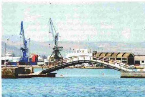
Σχέδιο αξιοποίησης δέκα ακόμη λιμανιών της χώρας που βρίσκονται υπό τη διαχείριση του ΤΑΙΠΕΔ. Πρόκειται για το Βόλο (φωτογραφία), της Ραφήνας, της Ηγουμενίτσας, της Πάτρας, της Αλεξανδρούπολης, του Ηρακλείου, της Ελευσίνας, του Λαυρίου, της Κέρκυρας και της Καβάλας

«Θα παρακολουθήσουμε το θέμα στενά μέχρι να μπουλνάζει και να αρχίσουν να προλαμβάνονται άνθρωποι για να δουλέψουν στον χώρο», αναφέρει χαρακτηριστικά στέλεχος της Ευρωπαϊκής Επιτροπής που βρίσκεται πολύ κοντά στη διαπραγμάτευση, σαφές μήνυμα ότι για ζητήματα αυτού του επιπέδου η επιτήρηση θα συνεχιστεί και μετά την ολοκλήρωση του μνημονίου τον Αύγουστο του 2018.