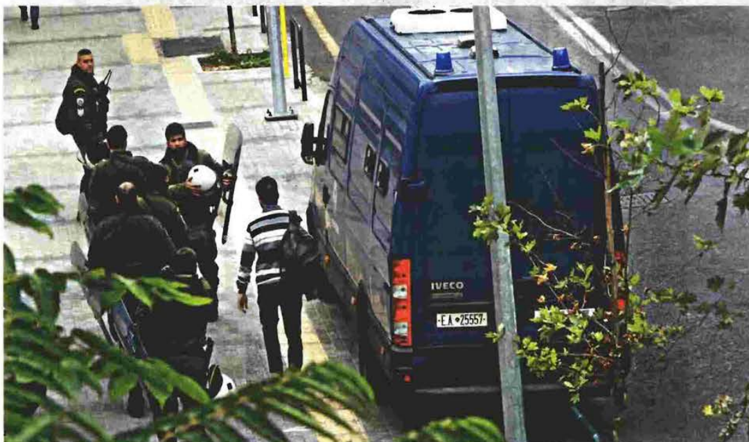
Ο 29χρονος εμφανίστηκε χθες ενώπιον του εφέτη ειδικού ανακριτή για θέματα τρομοκρατίας και πήρε προθεσμία προκειμένου να απολογηθεί σήμερα στις 7 το απόγευμα

● Ο 29χρονος μέσω του συνηγόρου του αρνείται ότι είναι μέλος των Πυρήνων, ενώ με δήλωσή της η Πόλα Ρούπα διαψεύδει ότι αυτός είχε σχέση με τον Επαναστατικό Αγώνα αποδομώντας τη θεωρία των «συγκοινωνούντων δοχείων»