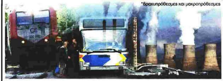
*Βραχυπρόθεσμες και μακροπρόθεσμες

Στην περίπτωση, για παράδειγμα, του ΟΑΣΑ, κρίνεται, σύμφωνα πάντα με τις πληροφορίες, απαραίτητο να βελτιώσει άμεσα τα περιθώρια καθαρού και λειτουργικού του κέρδους, να «δει» ξανά τις εσωτερικές του λειτουργίες και να βελτιώσει συνολικά την αποδοτικότητα του. Αποκλείεται η παραχώρηση ποσοστού σε ιδιώτη, αφού σε μια τέτοια περίπτωση τα εισιτήρια θα αυξάνονταν, αλλά και θα απεντάσσονταν ενδεχομένως τρέχοντα έργα ΣΔΙΤ, κοινή παράμετρος για όλες τις ΔΕΚΟ των μεταφορών και υποδομών. Ειδικά για τις Αστικές Συγκοινωνίες αναφέρεται ότι πρέπει να προβούν σε συνολικό ανασχεδιασμό του συγκοινωνιακού τους έργου με αναδιοργάνωση του στόλου τους (λεωφορεία, τρέλεϊ), πλήρη συγκοινωνιακή κάλυψη όλων των περιοχών, συνεργασία με τα μέσα σταθερής τροχιάς κ.ο.κ.