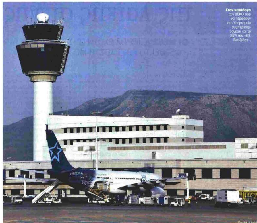
Είκοι κατάλογοι των ΔΕΚΟ που θα περάσουν στο Υπερταμείο συμπληρωμένο δίνεται και το 25% του «Επ. Βενιζέλος».

πρέπει: α) Ενα μέρος να αποδίδεται ως μερίσμα στο ελληνικό Δημόσιο και να χρησιμοποιείται από αυτό για επενδύσεις σύμφωνα με την παράγραφο 3 του Αρθρου 200 του παρόντος νόμου, και β) Ενα μέρος να χρησιμοποιείται από την εταιρεία για επενδύσεις και μπορεί να διακρατηθεί για να καλυφθούν πιθανές μελλοντικές ζημιές.