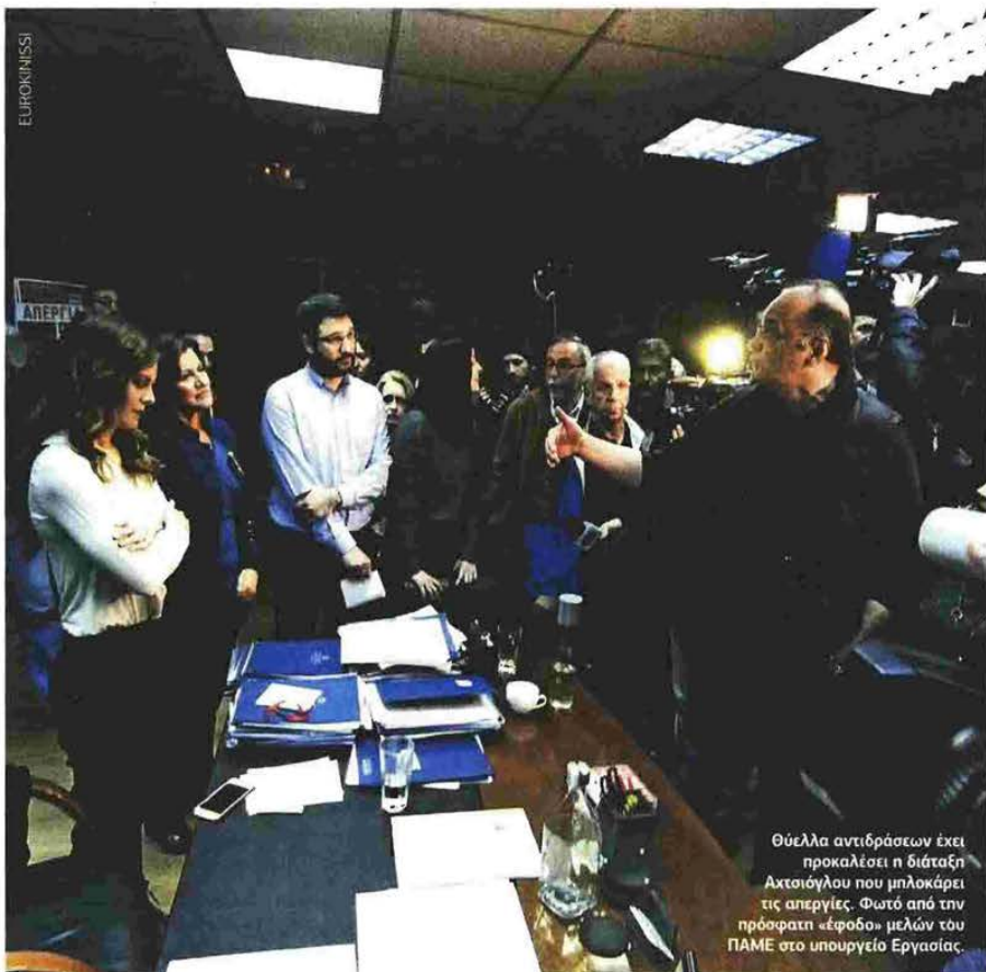
Θύελλα αντιδράσεων έχει προκαλέσει η διάταξη Αχτσιόγλου που μπλοκάρει τις απεργίες. Φωτό από την πρόσφατη «έφοδο» μελών του ΠΑΜΕ στο υπουργείο Εργασίας.

Η ρύθμιση που εισήγαγε η υπουργός Εργασίας μπαίνει ως προσηθική στο άρθρο 8 του ν. 1264 και μάλιστα μπαίνει στην τελευταία παράγραφο του άρθρου και λέει ότι «ειδικά για τη συζήτηση και λήψη απόφασης κήρυξης απεργίας, απαιτείται η παρουσία τουλάχιστον του ½ των οικονομικά τακτοποιημένων και, αν είναι λιγότεροι, η απόφαση λαμβάνεται ακόμη και με το ¼ σε επαναληπτική συνέλευση. Αρκούσε δηλαδή και το 20% για απεργία. Με την προσηθική της διάταξης η κ. Αχτσιόγλου όρισε ότι «ειδικά για απεργία απαιτείται το 50%+1 των εργαζομένων».