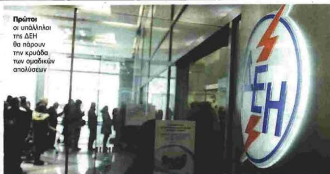
Πρώτοι οι υπάλληλοι της ΔΕΗ θα πάρουν την κρυάδα των ομαδικών απολύσεων