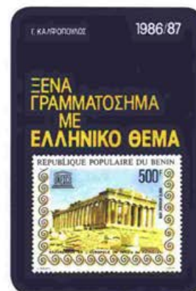
Το περιπούδαστο βιβλίο του Γ. Καλφόπουλου για την παρουσία της Αρχαίας Ελλάδας και του Βυζαντίου στον Παγκόσμιο Φιλοτελισμό.