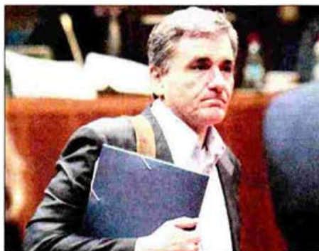
Σύμφωνα με πηγές από την ελληνική ομάδα διαπραγμάτευσης, υπάρχουν 4-5 «αγκυλάκια», τα οποία πρέπει να λυθούν για να επιτευχθεί η συμφωνία.

Δεύτερο θέμα, ήταν η χρέωση προμηθευτή που θα παραταθεί και το 2020. Θα παραμείνει με σταδιακή μείωση και μετά θα αντικατασταθεί από το πρόσδιο πιστοποιητικό. Τρίτο θέμα ήταν η ιδιωτικοποίηση της ΔΕΠΤΑ, για την οποία ο υπουργός είπε ότι «καταθέσαμε την πρόταση μας και θα γίνουν διαβουλεύσεις μέχρι το Σάβ-