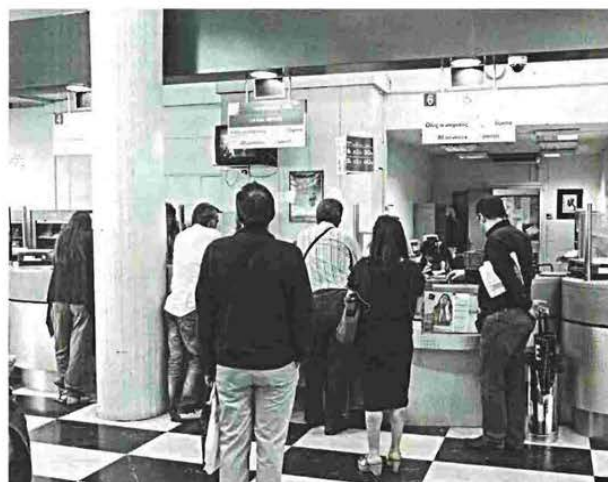
Μια ιδιόρρυθμη υπόθεση απασχολεί την οικογένεια των εργαζομένων των Ελληνικά Ταχυδρομεία της Πάτρας

Αυτό έχει ως συνέπεια, αυτή τη στιγμή, ενάμιση μήνα μετά τη διατάραξη του αμιάντου, να μην βρίσκουν οι μετρήσεις ίνες ορατές στο