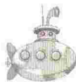
Χιουμοριστικό Περισόπιο Γράφει ο Σ.