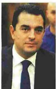
Σύμφωνα με τον τομέαρχη Περιβάλλοντος και Ενέργειας της Ν.Δ. Κώστα Σκρέκα, η ζημία της κυβέρνησης στη ΔΕΗ είναι μετρήσιμη και φτάνει τα 4,1 δισ. ευρώ.

Ιδιαίτερα ανησυχητική είναι και η κατάσταση που παρουσιάζει για τα ΕΛΤΑ και η διοίκηση του Υπερταμείου. Μέσα από το στρατηγικό σχέδιο που έδωσε στη δημοσιότητα τον περασμένο μήνα προκύπτει ότι για το 2016 (οικονομικά αποτελέσματα του 2017 δεν έχουν δημοσιευτεί) ο κύκλος εργασιών της εταιρίας βαίνει διαρκώς μειούμενος. Το 2016 έπεσε στα 311,8 εκατ. ευρώ από 337 εκατ. ευρώ το 2015 και από 370 εκατ. ευρώ το 2014. ■