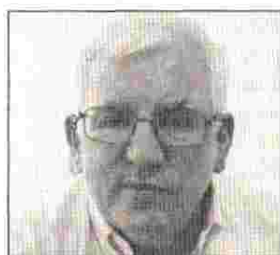
Του ΠΑΝΟΥ ΤΡΙΓΑΖΗ

«Ε τος Μπάιρον» έχει οριστεί από πολλούς φορείς το 2018, με την ευκαιρία της συμπλήρωσης 230 χρόνων από την γέννηση του μεγάλου ποιητή και κορυφαίου των φιλελλήνων Λόρδου Βύρωνα. Πολλές εκδηλώσεις προγραμματίζονται, με κορυφαία μια συναυλία στο Θέατρο Βράχων Άννα Συνοδινού, υπό τον τίτλο Στον Μπάιρον της Ελλάδας και του κόσμου. Η είσοδος θα είναι ελεύθερη και όσοι πιστοί προσέλθετε.